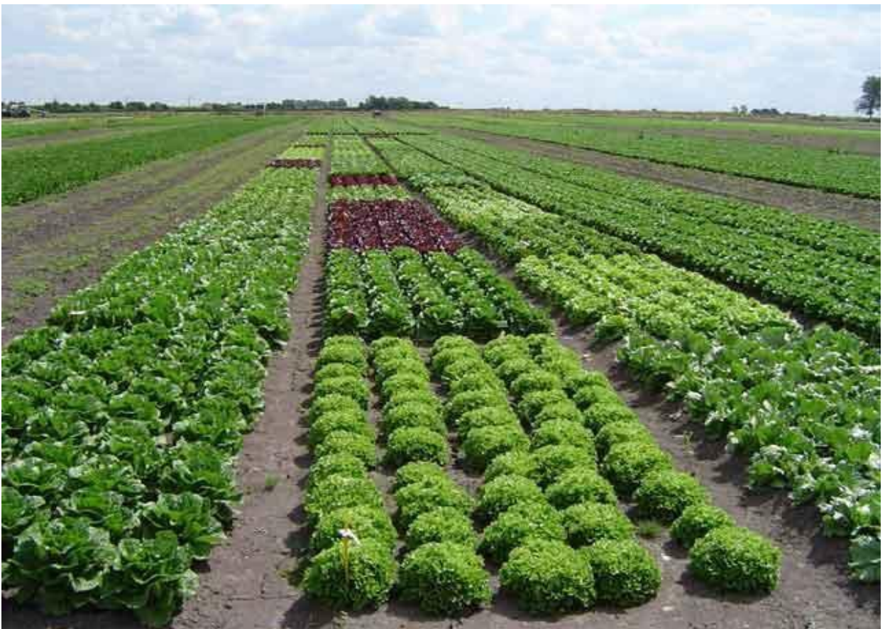
Figura 1 – Fotografia de horta. Maceió: Alagoas na Net, 2015

Qualquer que seja o tipo de ilustração, sua identificação aparece na parte inferior, precedida da palavra designativa (desenho, esquema, fluxograma, fotografia, gráfico, mapa, organograma, planta, quadro, retrato, figura, imagem, entre outros), seguida de seu número de ordem de ocorrência no texto, em algarismos arábicos, travessão e do respectivo título. Após a ilustração, na parte inferior, indicar a fonte consultada (elemento obrigatório, mesmo que seja produção do próprio autor), legenda, notas e outras informações necessárias à sua compreensão (se houver). A ilustração deve ser citada no texto e inserida o mais próximo possível do trecho a que se refere (ABNT, 2011, p. 11).