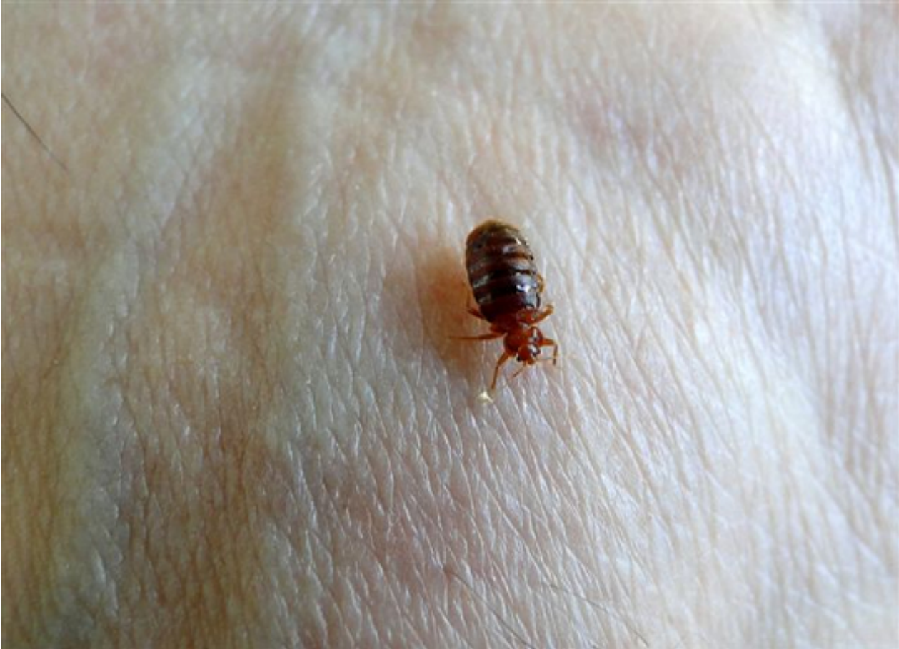
Percevejo de cama