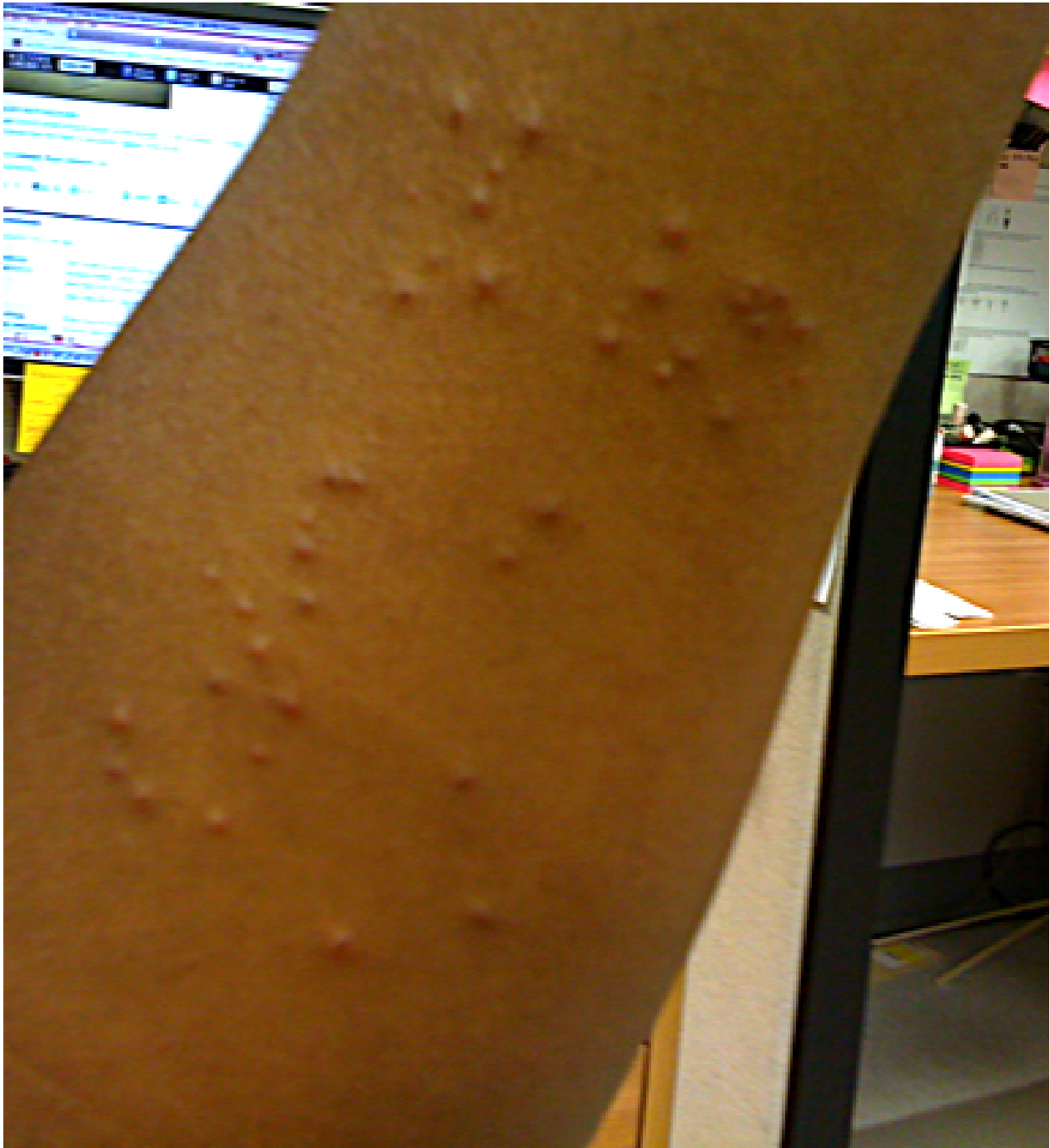
Picadas de percevejo de cama