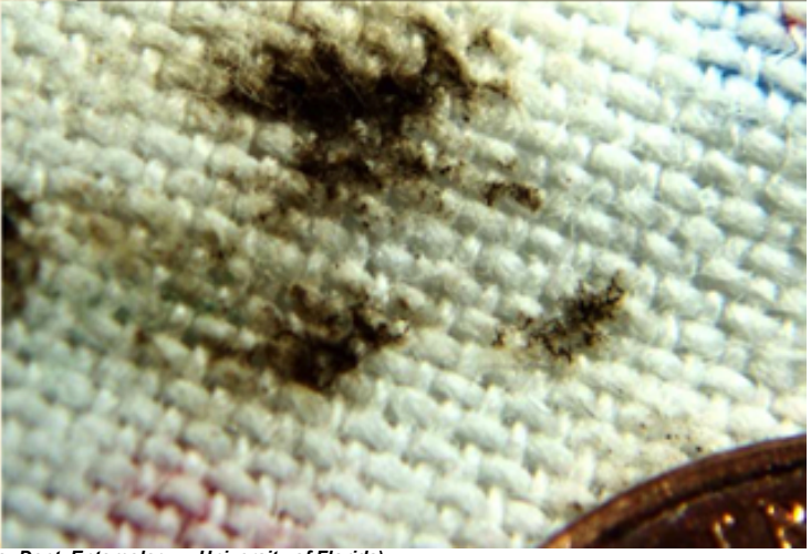
Perceijos de cama agregados e fezes de percevejo de cama