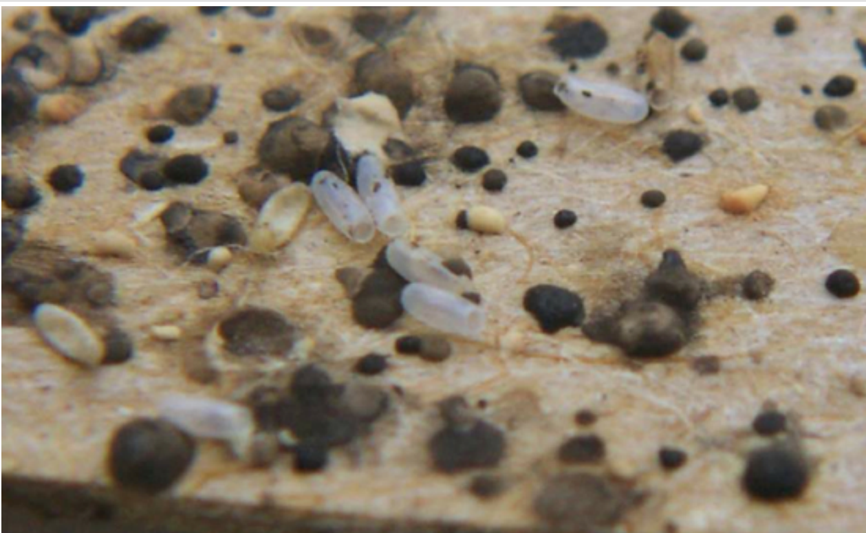
Fezes e ovos de percevejo de cama